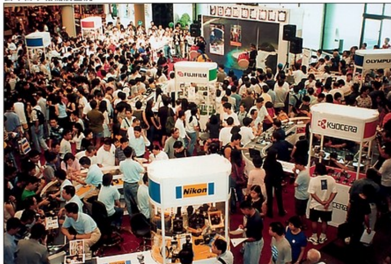
去年日本相機展盛況